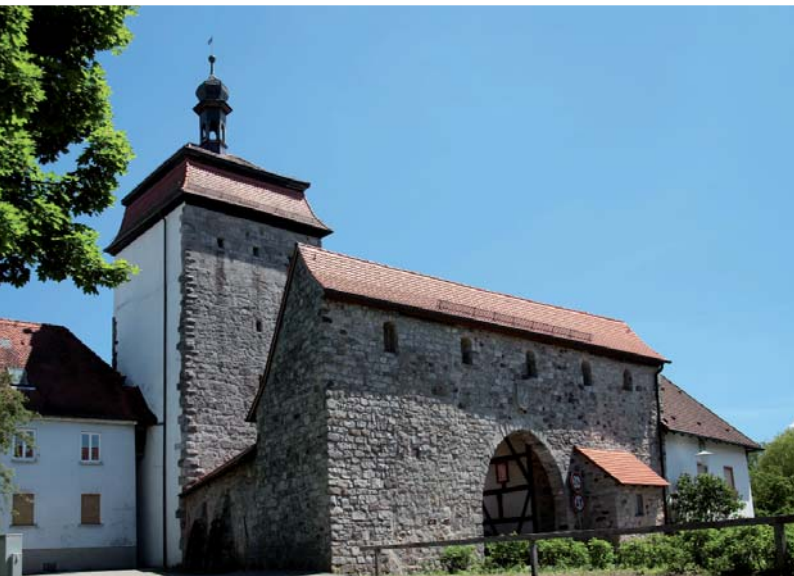
Das „Obere Tor“ ist Bestandteil der mittelalterlichen, spätgotischen Befestigungsanlage in Schlüsselfeld.

Öffnungszeiten: 1. Mai bis September Fr, Sa ab 17.00 Uhr So + feiertags ab 14 Uhr