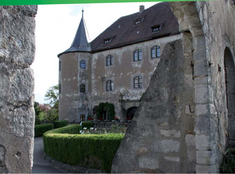
Das vierflügelige Wasserschloss Breitenlohe mit runden Ecktürmen wird um 1340 erstmals urkundlich erwähnt. Es befindet sich heute in Privatbesitz