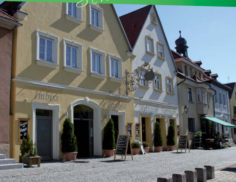
Das Ensemble von liebevoll restaurierten Bürgerhäusern beiderseits der Straße prägt das Bild des Schlüsselfelder Marktplatzes.