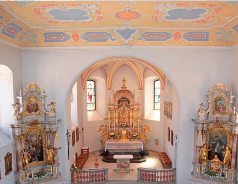
An der westlichen Stadtmauer Schlüsselfelds erhebt sich die Marienkapelle. Der Barockbau ist auf das Patrozinium „Maria, Helferin der Christen“ geweiht und bildet vom Gnadenbild eine originalgetreue Kopie des berühmten Wallfahrtsortes Marizell in der österreichischen Steiermark.