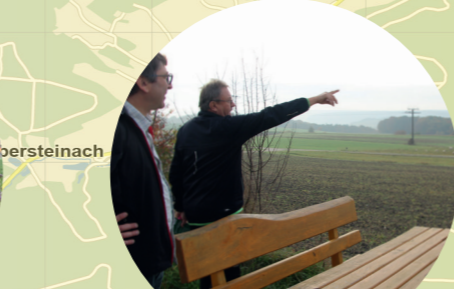
5 Großbirkach Richtung Ebersbrunn