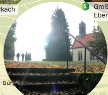
6 Kapelle Hohn am Berg