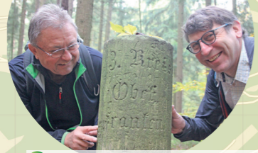
3 Drei fränkische Urgewächse

Der alte Drei-Franken-Stein Diese Stelle markiert das Zusammenreffen der 3 fränkischen Grenzlinien ab 1810 stifteten hier die bayerischen Verwaltungspräse Ober- und Regensburg zusammen. 1837 erfolgte die Umbenennung in Ober- und Unterfranken. Im Jahre 1897 wurde der Drei-Franken-Stein gestrichelt. Dieser Grenzstein ist bis zur Gebietsreform 1972 die "Drei-Franken-Ecke", das Berühmtesten fränkischen Rechensteingebäude. Heute noch sind die ehemaligen Grenzverläufe im Wald zu erkennen. 1993 wurde der stark verwitterte Stein durch die fränkischen Steiner Steigerwaldklub-Gesellschaft restauriert. Durch die Gebietsreform wurden die 3-Franken-Grenzen (ca 5 km Richtung Süd-Ost, also Richtung Burghauslach) verlegt. Die alten Grenzsteine werden diesen Stein als heimatspezifisches Zeugnis erhalten.