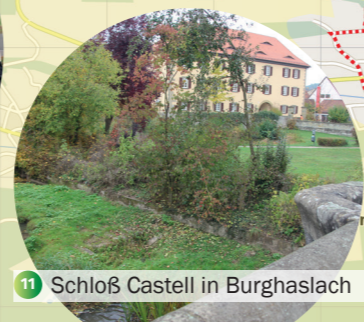
11 Schloß Castell in Burghaslach