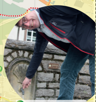
9 Jakobsbrunnen in Schüsselselfeld