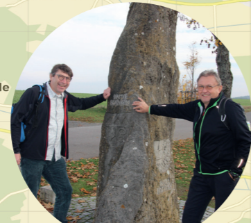
1 Drei-Franken-Stein Rosenbirkach