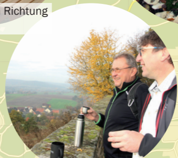
7 Blick ins Tal