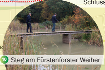
10 Steg am Fürstenforster Weiher

Bitte den passenden Stempel auf das vorgesehene Feld stempeln.