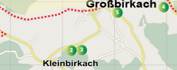
2 3 Kleinbirkach