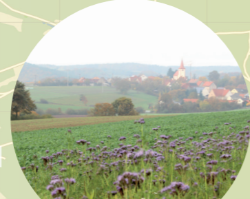
4 Blick auf Großbirkach