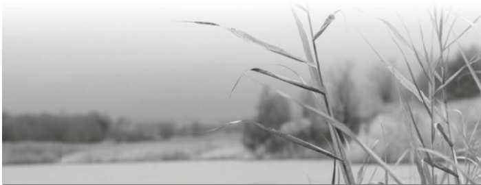
Bereiche Burghaslach, Geiselwind, Scheinfeld und Schlüsselfeld

Wir kooperieren seit Anfang 2019 mit dem Hospiz-Verein Neustadt a.d. Aisch e.V. Deshalb erreichen Sie uns in Zukunft unter der Tel.-Nr.: (0 91 61) 6 29 09 oder per Mail unter: info@hospiz-nea.de