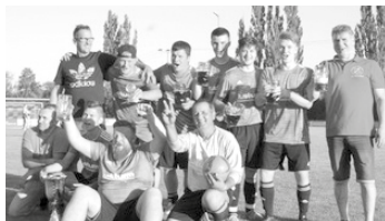
Die Sieger des FirmenCup 2019, Werkzeugschleiferei Sturm.