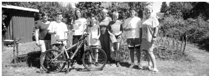
Auf dem Bild von links nach rechts: