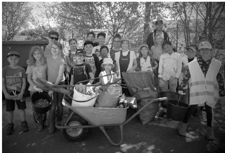
Die Wanderjugend des Steigerwaldklubs Burghaslach mit dem Ergebnis ihrer Müllsammelaktion.

Fundstücke, half beim Sortieren und besprach mit den Kindern die fachgerechte Entsorgung. Beim anschließenden Rundgang durch die Einrichtung erläuterte er die einzelnen Müllarten, ihre Verwertbarkeit und, am Beispiel von PET-Flaschen oder Stapelchipsackungen, die Verwertungswege. Der durch Zerkleinerung und Zermahlen wiedergewonnene, granuliert Kunststoff dient der Industrie als hochwertiger Ausgangsstoff für neue Kunststoffbehältnisse, zum