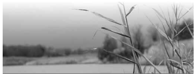
Bereiche Burghaslach, Geiselwind, Scheinfeld und Schlüsselfeld

Wir kooperieren seit Anfang 2019 mit dem Hospiz-Verein Neustadt a.d. Aisch e.V. Deshalb erreichen Sie uns in Zukunft unter der Tel.-Nr.: (0 91 61) 6 29 09 oder per Mail unter: info@hospiz-nea.de