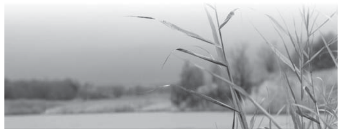
Bereiche Burghaslach, Geiselwind, Scheinfeld und Schlüsselfeld

Wir kooperieren seit Anfang 2019 mit dem Hospiz-Verein Neustadt a.d. Aisch e.V. Deshalb erreichen Sie uns in Zukunft unter der Tel.-Nr.: (0 91 61) 6 29 09 oder per Mail unter: info@hospiz-nea.de