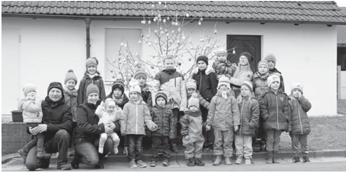
Auf dem Foto die Heuchelheimer Kinder.

nens nach den Osternestern. Die Erwachsenen konnten es sich bei Kaffee und Kuchen gemütlich machen. Über die Osterfeiertage wird nun der geschmückte Osterbrunnen Heuchelheim verschönern.